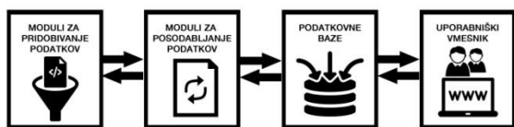
Slika 1: Modularna zgradba računalniškega sistema (Blatnik in Jarm, 2015).

S treh izbranih spletnih portalov smo tako zbrali podatke o 29.904 novicah, za katere je bilo objavljenih 981.068 komentarjev. Moderatorji so izbrisali 80.515, torej 8,21 % komentarjev. Najvišji odstotek izbranih komentarjev je imel portal 24ur.com (10,07 %), najnižji pa MMC RTV Slovenija (5,02 %). Povprečna dolžina komentarjev je bila 191 znakov, pri čemer je imel najdaljšo povprečno dolžino komentarjev portal MMC RTV Slovenija (284 znakov), najkrajšo pa portal 24ur.com (133 znakov).