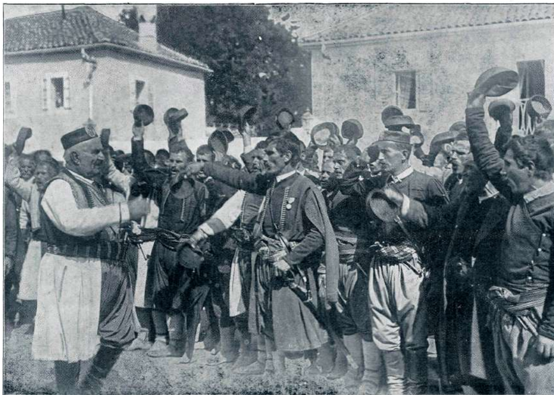
NIKOLA PETROVIĆ NJEGUŠ, KRALJ ČRNOGORSKI, POZDRAVLJAN OD LJUDSTVA

po njej revno človeštvo in pada iz zmote v zmoto in izgublja dan za dnem svoje moči? Ali se ti to revno in šibko ljudstvo prav nič ne smili? — In glej, ako bi to ljudstvo ne videlo jasne luči in krepke moči odpovedi, bi popolnoma zabredlo in izgubilo vso vero v svojo moč in bi se zavekomaj potopilo v močvirju. — Kakor šibi moči in voljo zgled slabega, tako jih krepí in jači zgled dobrega. In ker je na svetu toliko slabega, je treba tudi mnogo dobrega, in ker je na njem toliko neizmernega uživanja, je treba tudi veliko brezpogojnega zatajevanja, sicer