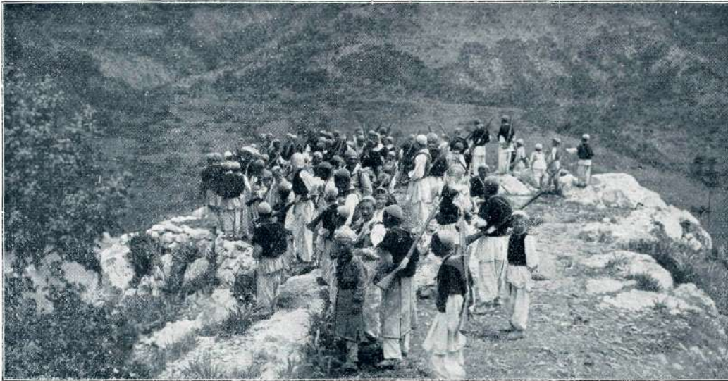
MIRIDITI; V ALBANSKIH GORAH.