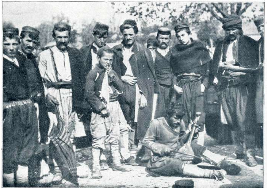
GUSLAR PEVA O TURŠKI VOJSKI.

„Zakaj ne Alma? Črnič bo stal na kolodvoru — pozdravil bo . . . Kaj naj bi govorila še po tem, kar se pomeniva drevi? . . . Spremil bo Almo domov — spremljal bo Almo . . . Druga sreča bo odkupljena z mojo . . .“ Bolj sama sebi kakor materi je govorila brezglasno Helena. Mati, ki ni mogla premagati očitanja svojega srca, je odhitela, da ne gleda več sence dušnega boja na bledem obrazku. Čutila je, da se je zgodilo tu nekaj, kar ne more več popraviti človeška roka, slutila je — veliko hčerkino žrtev. A v tem, ko je mati na