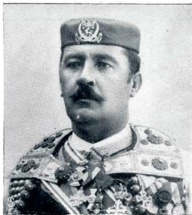
GENERAL JANKO VUKOTIĆ.