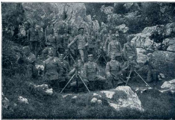
ČRNOGORSKE STROJNE PUŠKE.

„Tak značaj! Se ne sramuješ? Res, bil si vedno hinavec — rojen Črtomir. O! Ni značajnosti med nami, zato se ne razvije svoboda. Seveda!“