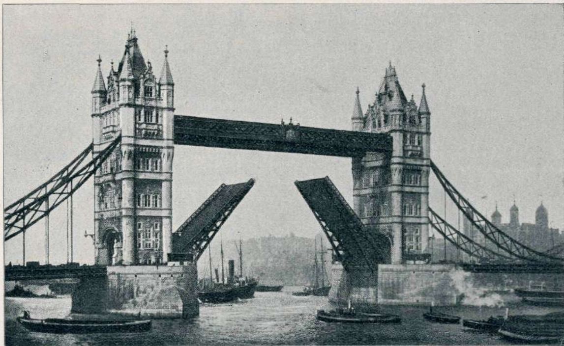
LONDON: TOWERSKI MOST.

Pepca je dvignila kozarec in vsi so veselo napivali Dominiku. On je trkal z njimi, pa nikogar ni pogledal v oči. Iskal je Malčkinih, pa jih ni našel. Kratek pogled — in še tedaj mu je odme knila oko. Dolge, črne vejice so se povesele na lice, katero je še bolj zardelo.