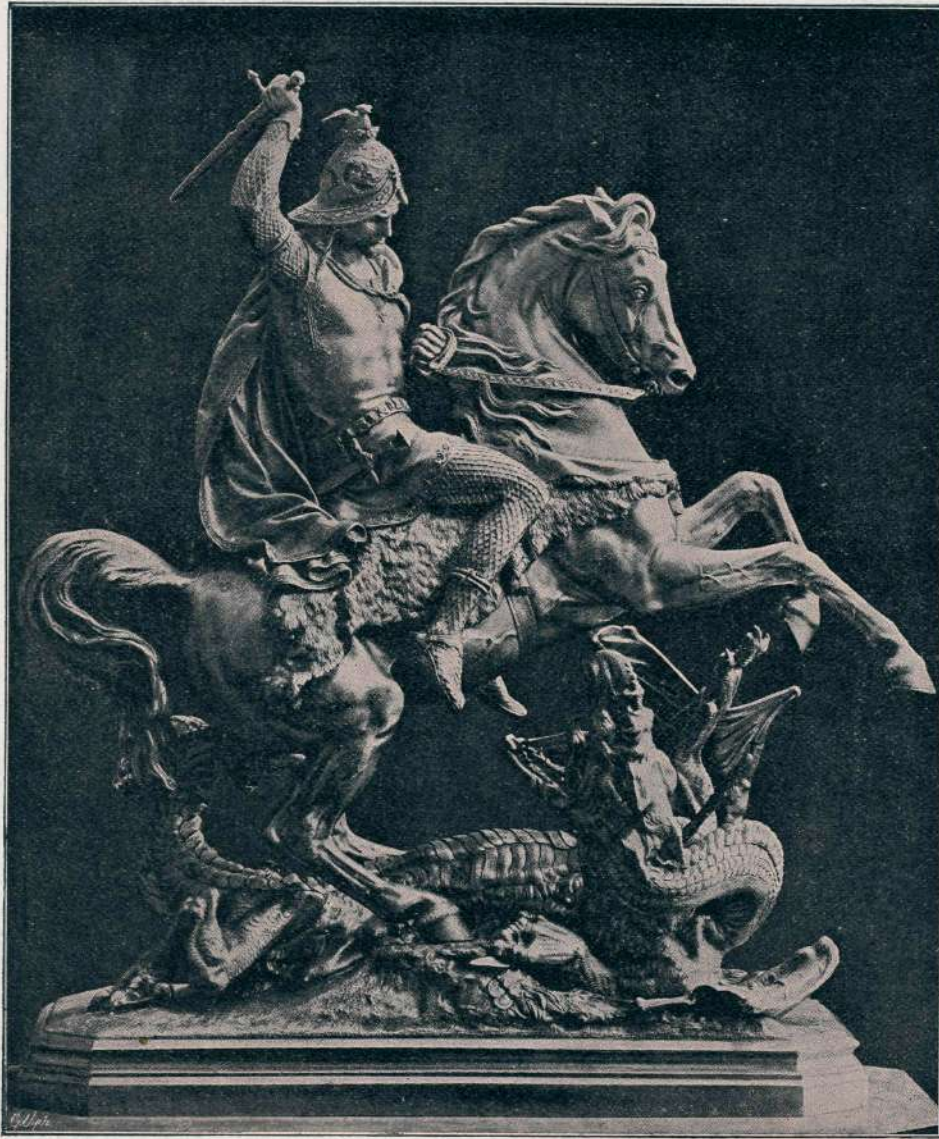
SPOMENIK SV. JURIJA V ZAGREBU.