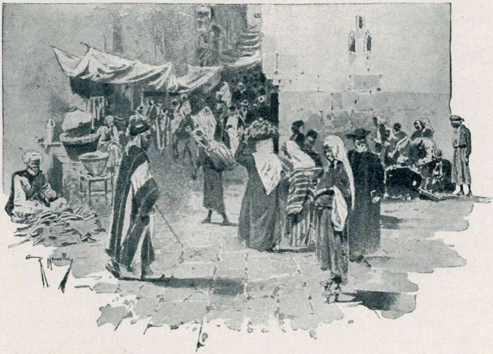
NA ULICI V JERUZALEMU.

Dve leti je ponujal kapital — in nikjer ga niso hoteli. Mrzlo so mu vračali nazaj