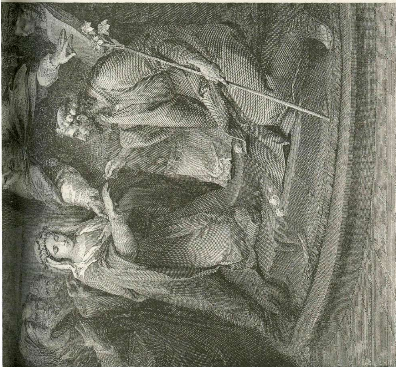
Zaroka Marije in sv. Jožefa. (Slikal Karol Vantloo.)

Lah je med tem zlezal pod klop ob steni in klical neprenehoma: „Madre, madre!“