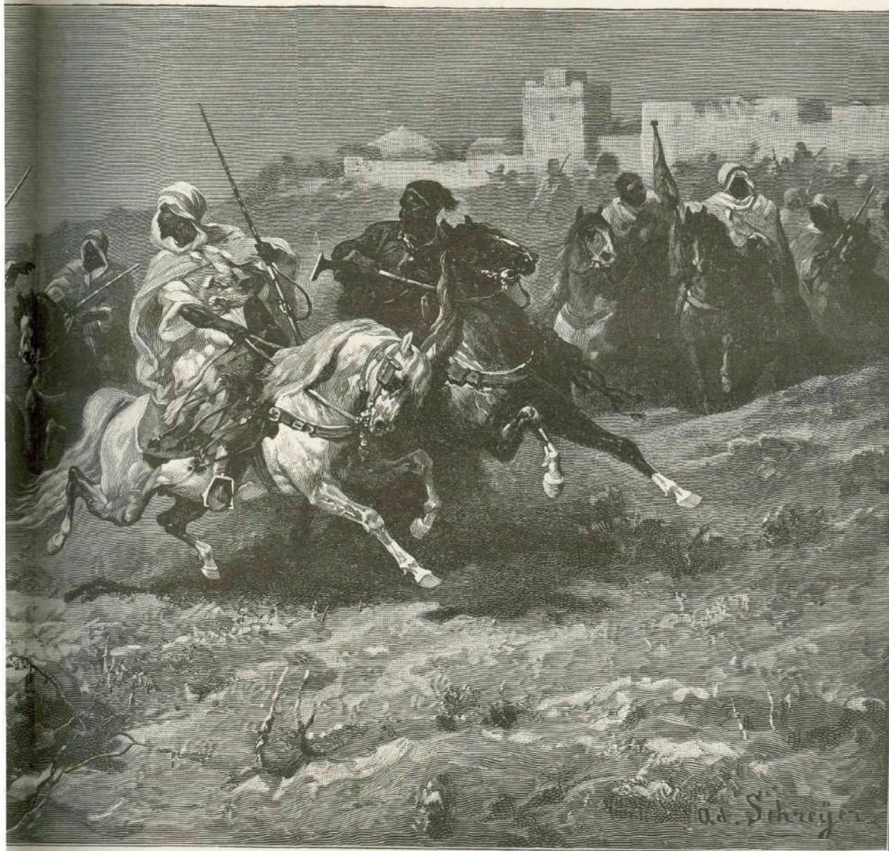
Sejh ide na boj. (Slikal Ad. Schreyer.)

Že je bil dober mrak. Ulice so se izpraznile, in celó na živahnem Črevljarskem mostu je bilo tiho. Barake mesarske so bile zaprte in tu pa tam se je še prikazal kak ponočevalec, zavrt v gorko obleko. Samo tam od Tranče niso prenehali zamolkli glasovi stokajočih jetnikov. Nekako neprijetno je to javkanje zbudlo mlado vdovo Tramterico, ki je hitela izpod obokane Tranče na Črevljarski most. Najbrže si je domislila, da utegne tudi ona zaradi detomora tu gori med hudodelci poiskati si novega stanovanja.