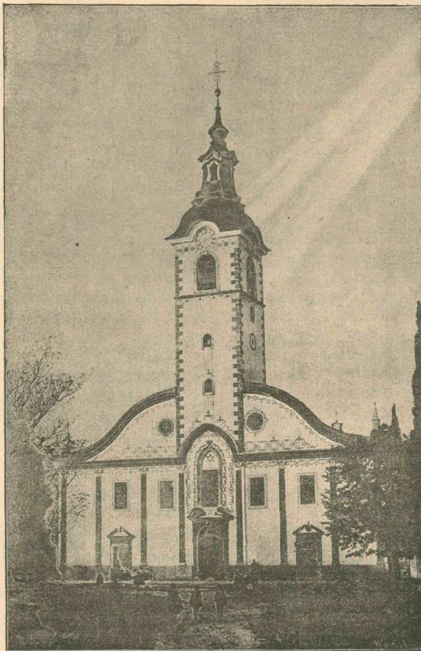
Romarska cerkev na Trsatu.

»Par je lep in mislim, da 160 gold. ne bode preveč.«