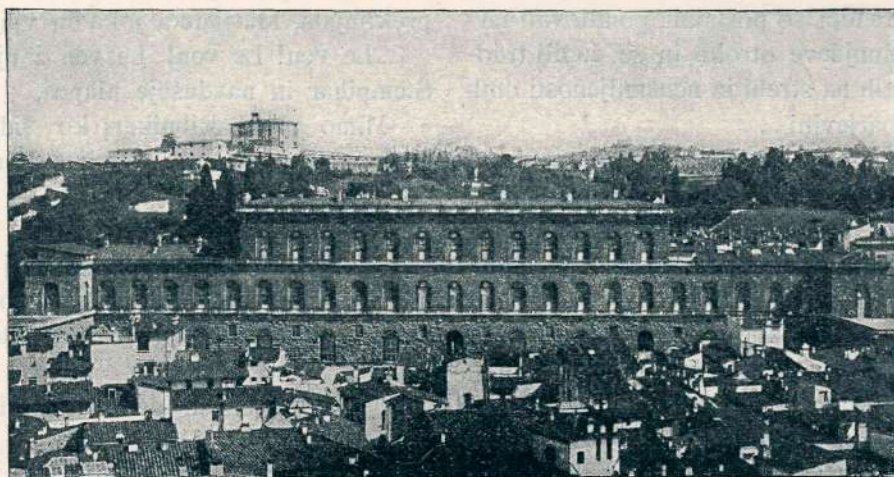
Palazzo Pitti v Florenciji.

Hu! Kako je to jezilo Štempiharja! Ali jim ni bil ukazal umakniti se v jednom tednu?