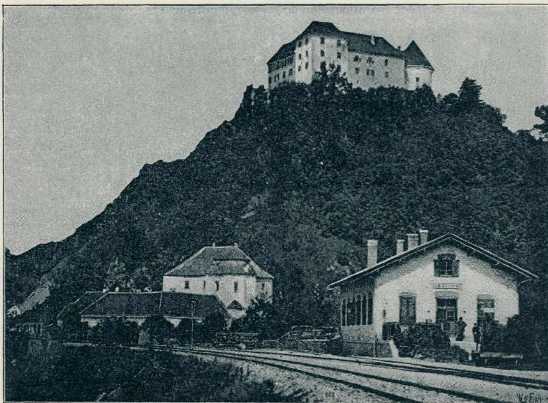
Rajhenburg na Štajerskem.