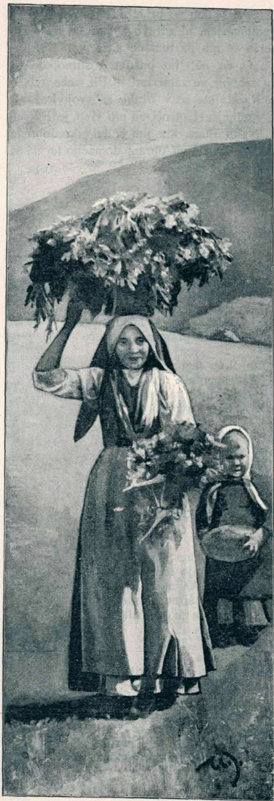
Sveža piča. Risal M. Jama.

„Vse naše! Vse naše!“ vzkliknil je razburjen, ko je pridrdral domov. „Vse naše! Juhuhuhu!“