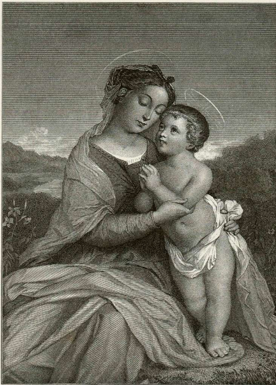
Mati Božja. (Slikal G. Staal.)

Tu le-sem se je napotila Marjetica drugi večer po pogovoru z Marijanko. Šla je urno po kolovozni poti, zatopljena samó v misli o svojem stanu, ne meneč se za nič drugega. Bila