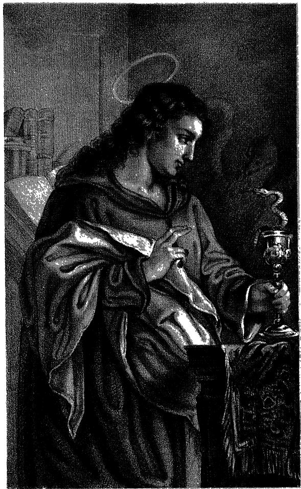
BRATERNÁ SVĚTIGA JANAŠA.